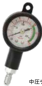
中圧チェックゲージ

[MU-0227] AP-0001A 中圧チェッカー ¥ 6,000 (税込 ¥ 6,600)