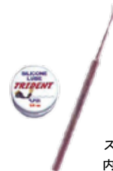
ステンレス製 内容量: 7 g

[MU-1253] DA79-1 Oリングツールキット 1本ステンレス ¥ 3,500 (税込 ¥ 3,850)