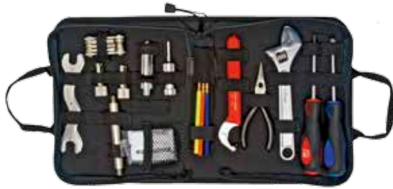
サイズ: 257 x 205 mm ステンレス製

[MU-4061] TM0090 プロフェッショナル ダイバーツールキット ¥ 38,000 (税込 ¥ 41,800)