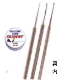
真鍮製 内容量: 7 g

[MU-1892] DA79B Oリングツールキット 3本セット真鍮 ¥ 7,500 (税込 ¥ 8,250)