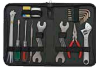
サイズ: 237 x 165 mm ステンレス製

[MU-2523] TM0110 DX ダイバーツールリペアキット ¥ 8,500 (税込 ¥ 9,350)