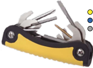
サイズ: 125 mm ステンレス製 11種類の工具を1つに収納。レギュ・オクトなどの中圧ホース取付・取り外しに便利です。

[MU-2383] TM0420 T2 スキューバツール ¥ 5,800 (税込 ¥ 6,380)