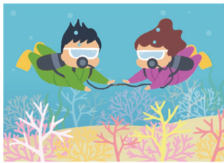
タンクのエアーを共有できます

ダイバーリンカは、使用しているレギュレータを外すことなく BC ホースを通じて、お互いのタンクのエアーを共有できるツールです。