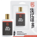
[MU-2573] GEAR AID シートタイプ