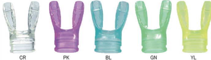
[MU-6634] BRUX JAXマウスピース カラー