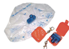
[MU-2564] AR20 CPR用ケツマスクキーホルダー