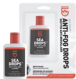
[MU-2574] GEAR AID シートタイプ