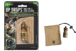
[MU-2222] GEAR AID OPTタイプ