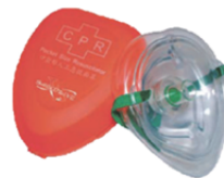
[MU-2579] AR10 CPR用ケツマスク