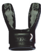
[MU-6633] BRUX JAXマウスピース BK