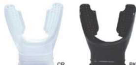
[MU-2592(CR)/2593(BK)] 1563S 口がらみ付シリコンマウスピース