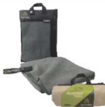
[MU-2360] XL サイズ サイズ：890 × 1575 mm [MU-2294] L サイズ サイズ：762 × 1270 mm [MU-2194] M サイズ サイズ：510 × 810 mm [MU-2295] S サイズ サイズ：250 × 510 mm